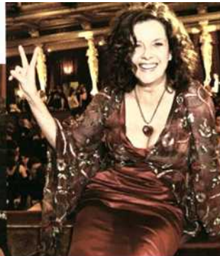
PUBLIKUMSLIEBLING Mezzosopranistin Angelika Kirchsclager genoss die Jubiläumsausgabe des Philharmonikerballes in vollen Zügen.