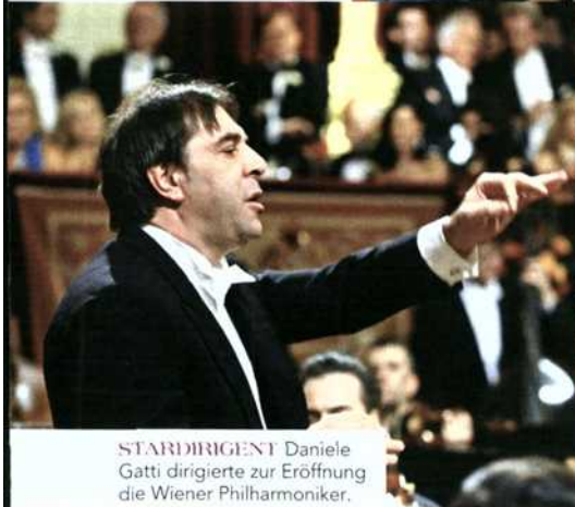
STARDIRIGENT Daniele Gatti dirigierte zur Eröffnung die Wiener Philharmoniker.