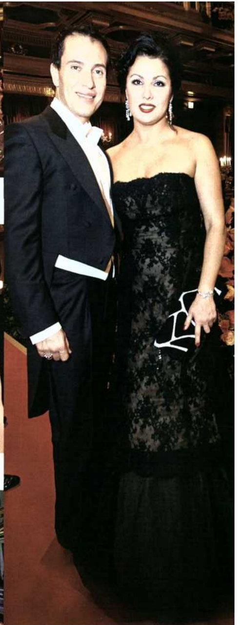
OPERN-TRAUMPAAR Anna Netrebko gab ihr Philharmonikerball-Debüt in einer traumhaften Spitzenrobe. An ihrer Seite: Lebenspartner Erwin Schrott.