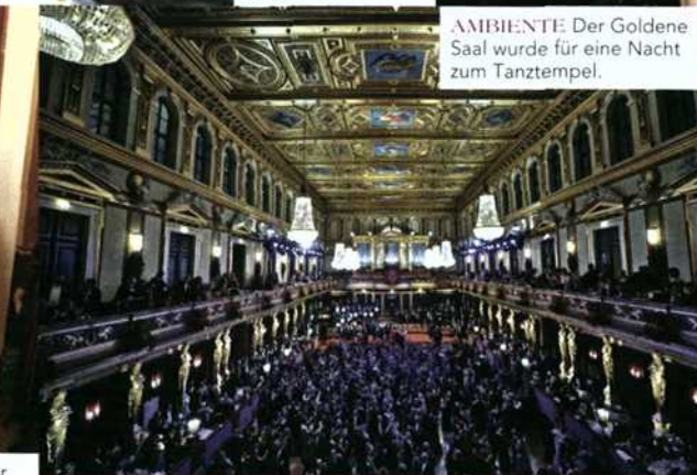
AMBIENTE Der Goldene Saal wurde für eine Nacht zum Tanztempel.

„Wien ist zurzeit im Ausnahmezustand. Die Menschen haben kleine Augen, weil sie bis in die Früh durchtanzen.“ (Dominique Meyer)