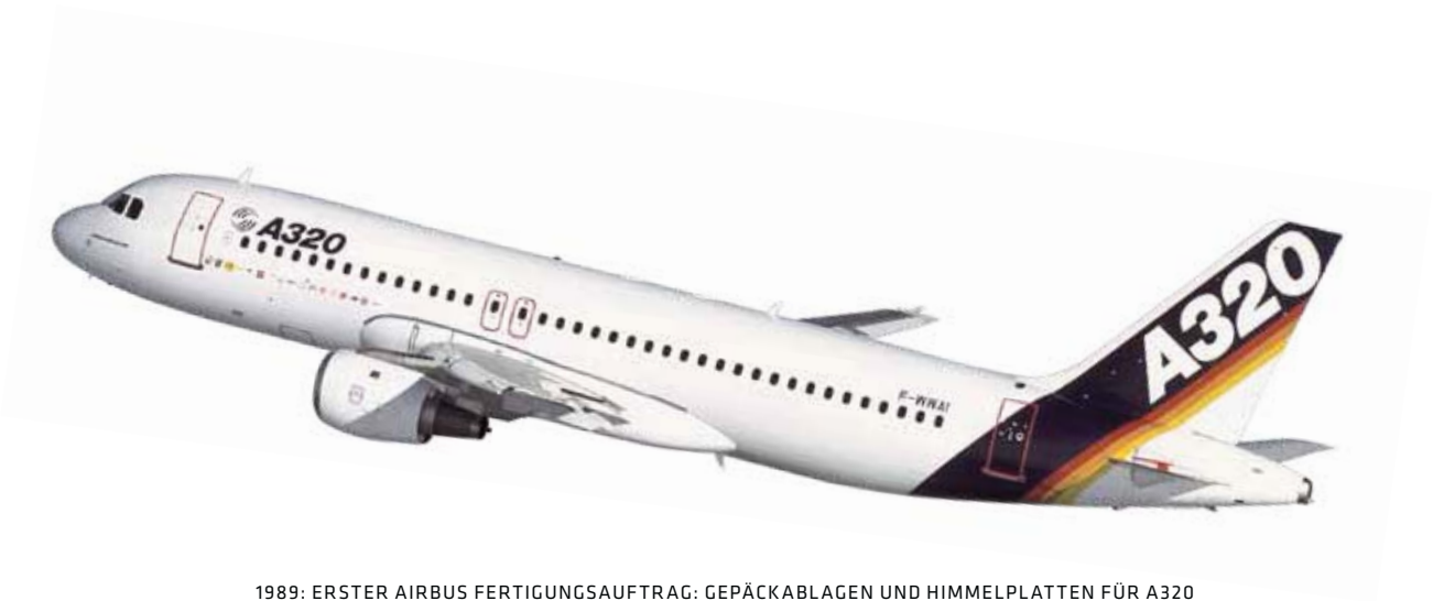
1989: ERSTER AIRBUS FERTIGUNGS-AUFTRAG: GEPÄCKABLAGEN UND HIMMELPLATTEN FÜR A320 1989: FIRST AIRBUS MANUFACTURING ORDER: OVERHEAD STOWAGE BINS AND CEILING PANELS FOR THE A320