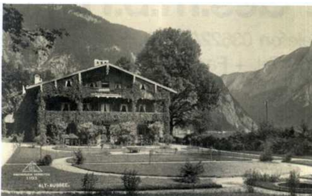
Historische Aufnahme vom Parkcafe