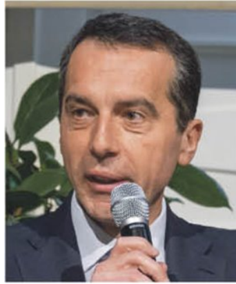
Christian Kern: „In den USA ist der Zukunfts-Optimismus einfach gewaltig.“