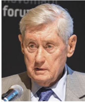
Hannes Androsch: „Die Unis brauchen mehr Geld, aber auch mehr Exzellenz-Ausrichtung.“