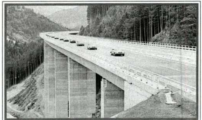
Im Juli 1980 war es soweit: das letzte Teilstück der Tauernautobahn von Gmünd bis Rennweg konnte feierlich seiner Bestimmung übergeben werden. Im Beisein von Vizekanzler Androsch, Bautenminister Sekanina und Landeshauptmann Wagner fand der Weihakt in Rennweg statt.