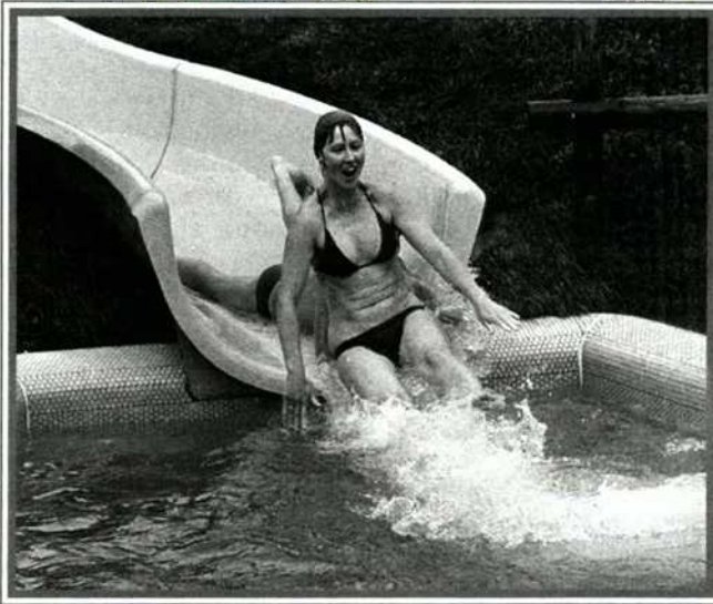
1981: Einen herrlichen Spaß bietet die neu errichtete Rutsche im Römabad Bad Kleinkirchheim.