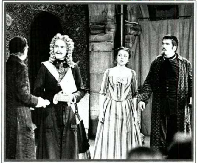
Mit Molières "Tartuffe" wurden im Juli 1981 die Komödienspiele im Schloss Porcia eröffnet.