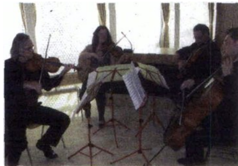
Das Leobener Streichquartett